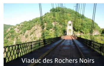
Viaduc des Rochers Noirs