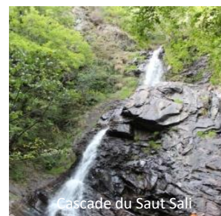
Cascade du Saut Sali