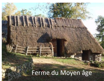
Ferme du Moyen âge